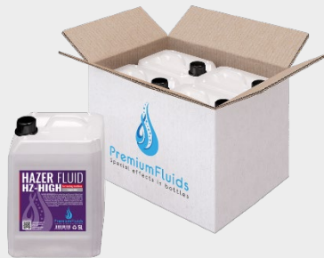
Cartons 6x2,5L – 4x5L