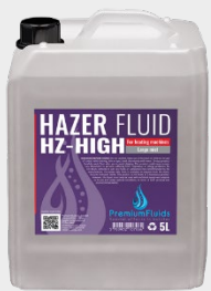
Bidons 2,5L – 5L – 10L – 20L 200L -1000L